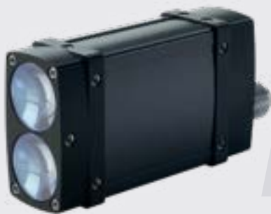
LDS70A für Messungen bis 70 m im Außenbereich

Der LDS70A verwendet nun eine neue Generation des Zeitmessschaltkreises, welcher eine auf 40 kHz gesteigerte Messfrequenz erreicht. Ebenso konnte die Reichweite bei Messungen ohne Reflektor auf 70 m erhöht werden. Die Firmware bietet zudem erstmals eine Auswahl zwischen dem stärksten oder dem am weitesten entfernten Ziel. Damit lassen sich Störungen und Messausfälle durch Staub, Nebel oder Regen im Laserstrahl verringern.